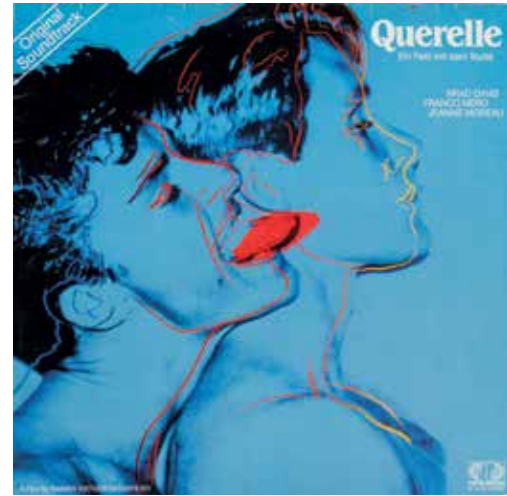
Soundtrack zum Film Querelle von R.W. Fassbinder, 1982

Absoluten Kultstatus hat mittlerweile das Album „The Velvet Underground & Nico“. Dieses Debütalbum der experimentellen Rockband The Velvet Underground mit der aus Köln stammenden Musik- und Modeikone Nico wurde von Andy Warhol produziert und im März 1967 veröffentlicht.