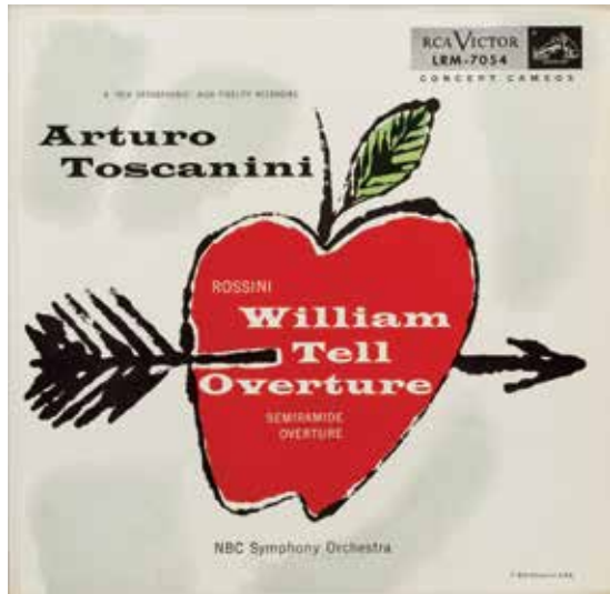
Rossini, Wilhelm Tell Ouvertüre, Semiramide Ouvertüre, 1954

Das MAKK präsentiert erstmals eine bislang unveröffentlichte Kölner Privatsammlung, die nahezu lückenlos alle von Andy Warhol konzipierten Plattencover sowie zahlreiche Skizzen und Entwürfe umfasst. Zusammen mit Filmen und Hörbeispielen dokumentiert die Ausstellung – getreu dem Titel „Pop goes Art“ – das Zusammenspiel der Medien Kunst und Musik.