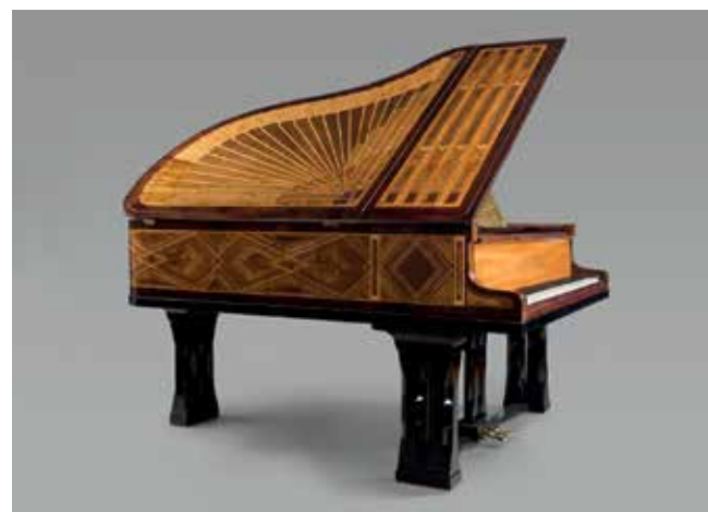
Peter Behrens, Salonflügel, Stuttgart, 1900/1901

Die lachende Kaffeekanne von Kaiser's Kaffee, das AEG-Waben-Logo, der Schriftzug „Dem Deutschen Volke“ am Berliner Reichstagsgebäude – jeder kennt diese Ikonen der Gestaltung. Urheber der Schöpfungen ist der in Hamburg geborene Künstler und Autodidakt Peter Behrens. Am 14. April 2018 jährt sich der Geburtstag des großen deutschen Gestalters und Architekten zum 150sten Mal. Besonders sein Wirken um die Jahrhundertwende bis zur Werkbund-Ausstellung in Köln hat seine Spuren in Kunst- und Designgeschichte hinterlassen.