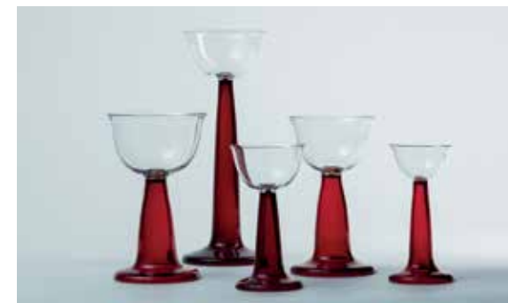
Peter Behrens, Gläserersatz mit rubinrotem Fuß, Köln-Ehrenfeld, 1901

Öffentlichkeit präsentiert werden. Der Fokus liegt dabei auf dem frühen Œuvre Peter Behrens' und insbesondere seinem Wirken im Rheinland.